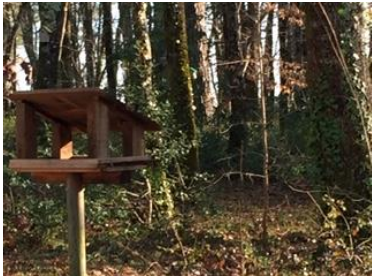
Deux mangeoires réapprovisionnées par des élèves en graines toutes les semaines