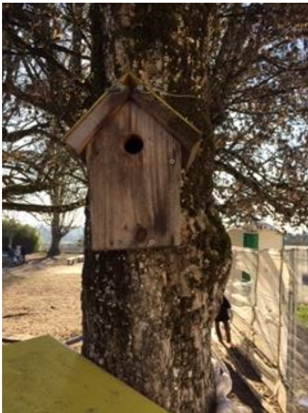
Une dizaine de niohirs