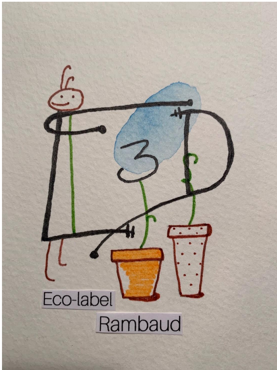
Logo réalisé par Elodie Ferreira (artiste et intervenante en Arts plastiques à l'école)